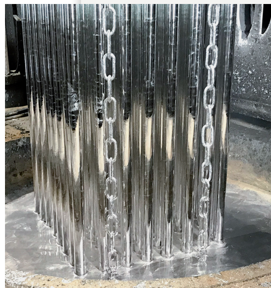
verticalZINQ-Tauchbad im Detail.

Die Verpackung der vor Korrosion geschützten Materialien wird nach Kundenwunsch vorgenommen — je nachdem wo sie gerade benötigt werden, ist daran ein flexibles Logistikkonzept gekoppelt. Teilweise werden die fertig verzinkten Materialien nach Absprache erst bei ZINQ in Kissing zwischengelagert, um termingerechte Auslieferungen zu gewährleisten. Etwa 800 Tonnen pro Jahr an PILA-Equipment, zu dem diverse Konsolen und Verschraubungen, aber eben auch die Schienen gehören, werden von Lausser selbst verbaut; circa 600 bis 800 Tonnen pro Jahr gehen an andere Unternehmen. „Wir beliefern sogar unseren Wettbewerb mit dem Montagesystem“, verrät Stefan Piendl. „Für uns bester Beweis, dass wir eine intelligente, funktionierende, aber auch in Sachen Qualität und Korrosionsbeständigkeit eben extrem belastbare Lösung entwickelt haben.“