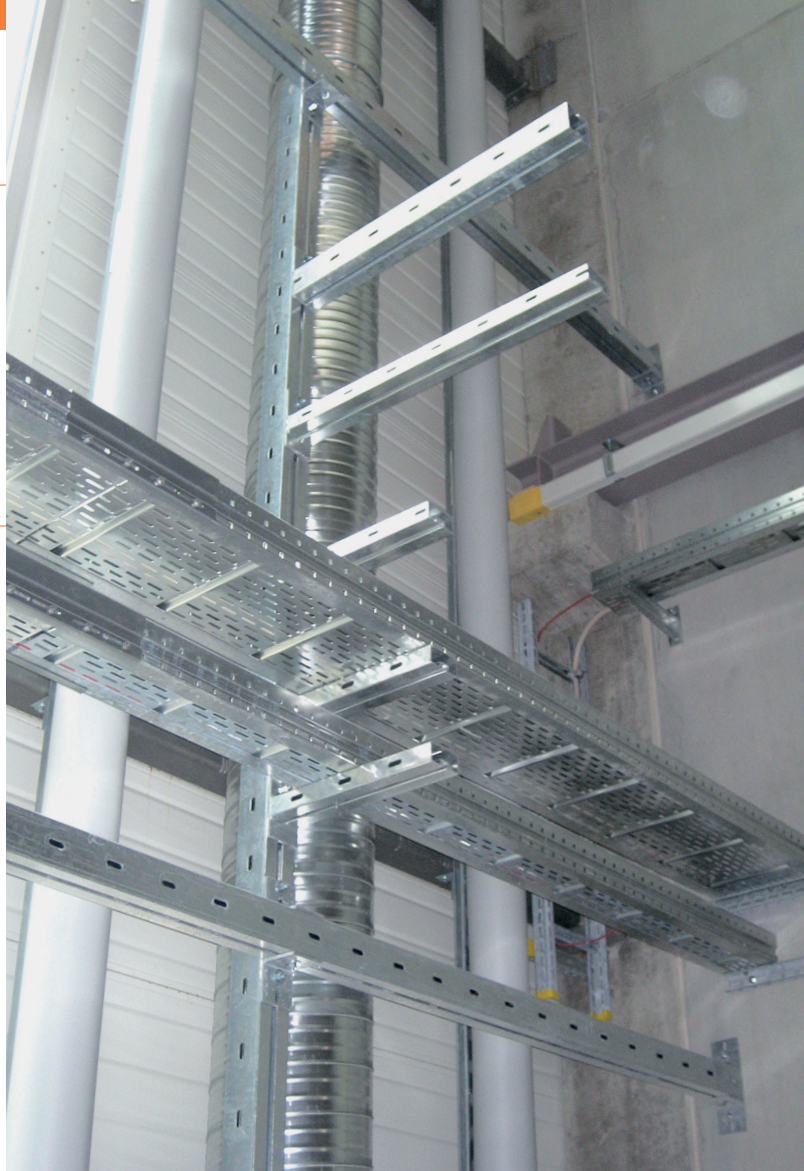
PILA-Montagesystem beim Endkunden.